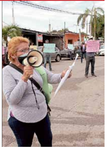
EL gobierno creará una red de enlaces para prevenir y resolver conflictos sociales.

APLICAN PRUEBAS RÁPIDAS de Covid-19 a turistas internacionales en Cancún, ya que en varias naciones es un requisito demostrar que no están infectados para que los dejen regresar